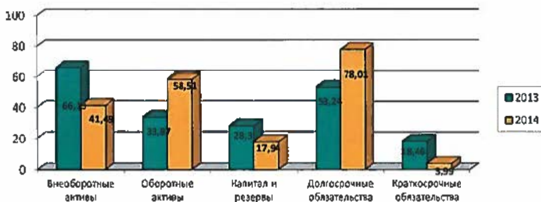
Рис.1 Изменение структуры баланса за 2013-2014 гг., %