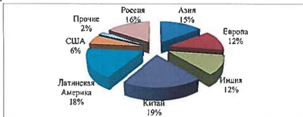
Рис. 1 Структура поставок ПАО «Уралкалий» за 2014 год по регионам.

Структура поставок ПАО «Уралкалий» за 2014 год по регионам представлена на рисунке 1.